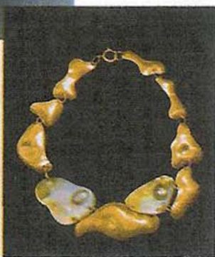
Un bracciale (in alto) e due collane create da Lucia Odescalchi.